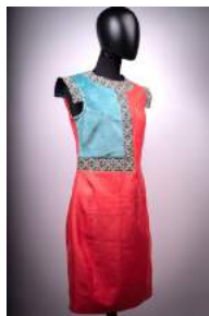
Fozia Hafiz, CHUUUTES