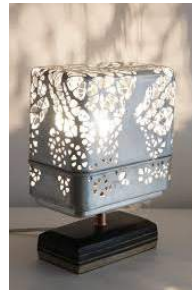
Sylvie Capellino, 1P2L

La ville de Nontron a été de tout temps à la fois rurale et industrielle. Ses filatures, ses tanneries, sa tradition coutelière ont fait, au fil des époques, la réputation de la ville. On compte aujourd'hui encore des entreprises prestigieuses comme Hermès (produits de luxe : maroquinerie, cravates, arts de la table), CWD (sellerie qui équipe de grands champions), 2 coutelleries fabricant « le Nontron » et « le Périgord », mais aussi des professionnels métiers d'art indépendants avec une présence importante à l'échelle du Périgord Vert.